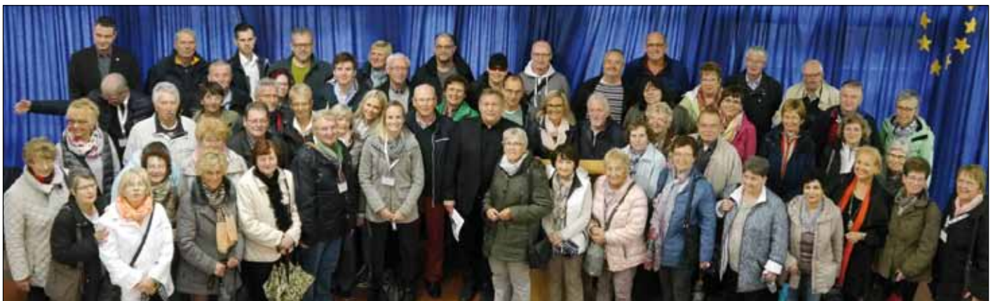
Vor dem Rundgang über das Gelände der Polizeischule trafen sich alle Teilnehmer zunächst in der Mensa der Einrichtung, um einige grundsätzliche Dinge mit Blick auf die angebotene Aus- und Fortbildung zu erfahren.

Bei anschließendem Kaffee und Kuchen nutzen die Bürgermeister die Gelegenheit, den Ehrenamtlern „ihrer Stadt“ persönlich Dank und Anerkennung auszusprechen. Dass es im kommenden Jahr ein kleines Jubiläum zu feiern gibt, wenn die dann fünfte „Dankeschön-Aktion“ ansteht, steht für alle Beteiligten bereits jetzt außer Frage. jh