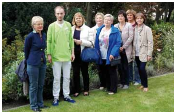
Die Mitglieder der Hospizgruppe Werne besuchten die neue Einrichtung in Lünen.

Ausstattung vor. Auch das Leben der dortigen Gäste mit ihren Angehörigen wurde beispielhaft erläutert. Die Gäste aus Werne stellten viele fachkundige Fragen (u. a. über die Voraussetzungen zur Aufnahme ins Hospiz und der Finanzierung des Aufenthaltes), wobei der Besuch mit einem Rundgang durch die Gemeinschaftsräume, der Besichtigung eines Gast-Zimmers und dem Aufenthalt in dem kleinen, das Hospiz umgebenden Garten endete