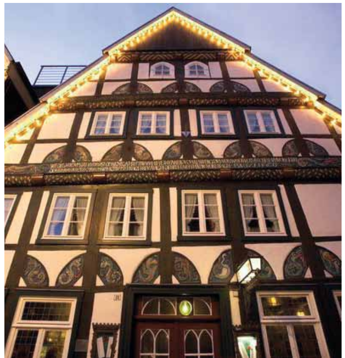
Verzierte Giebel in der Innenstadt Wiedenbrück verströmen eine besondere Atmosphäre.