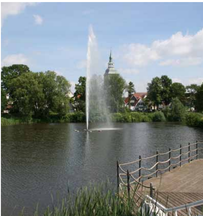
Am Emssee gelangt man vom Flora-Park in die Wiedenbrücker Altstadt.

Hamm - Ahlen - Beckum - Oelde - Rheda-Wiedenbrück = 59 km