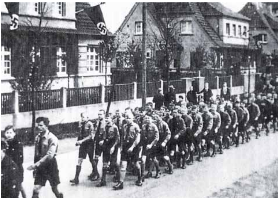
Nach der Machtergreifung der Nationalsozialisten im Januar 1933 wurden alle Jugendverbände aufgelöst und in die Hitler-Jugend (HJ) überführt.