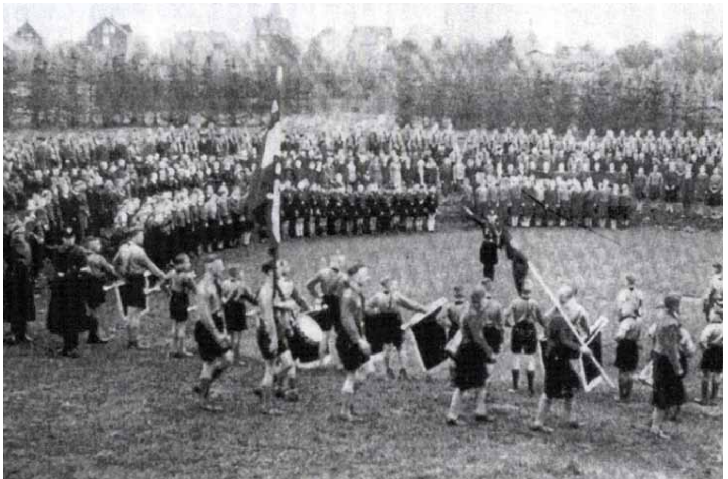
Der Bund Deutscher Mädel (BDM) war in der Zeit des Nationalsozialismus der weibliche Zweig der Hitlerjugend (HJ)