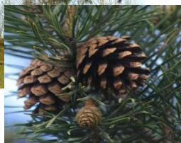
Früchte der Waldkiefer