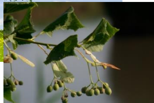
Früchte der Winterlinde