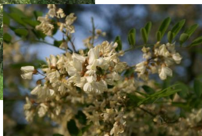
Blüten der Robinie