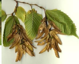
Früchte der Hainbuche