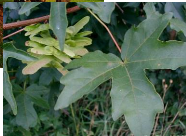
Früchte des Feldahorn