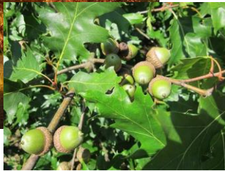
Früchte der Roteiche